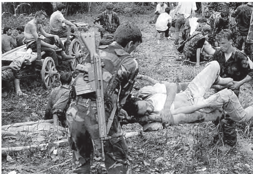
Mučenici Srebrenice nakon proboja na slobodnu teritoriju 16. jula 1995. godine.

Upotreba masovnih zračnih udara je, prilikom odsudnih trenutaka za opstanak Srebrenice, bila neophodna realnost, koja je izostala. Nasuprot tome, u stvarnosti se dogodilo granatiranje položaja mirovnih snaga Ujedinjenih nacija. Najave da će uslijediti zračni udari bile su prevara, pokušaj dobivanja na vremenu i pranja savjesti u suočavanju sa ogromnim razmjerama zločina. Tome su doprinijele birokratske procedure za odobravanje zračnih udara, ali i realnost da su mirovne snage Ujedinjenih nacija dopustile sebi da budu talac jedne vojske bez legaliteta.