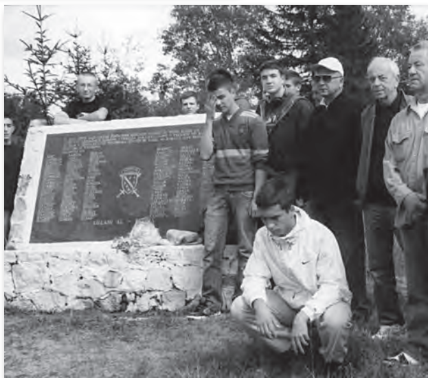
Kraj spomen – ploče šehidima 82. fočanske brigade koji su poginuli na Proskoku jula 1993. godine