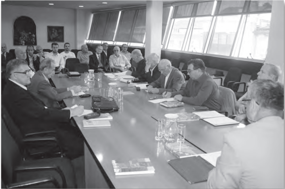
Sa „okruglog stola“

General Polutak je govorio o genezi velikosrpske i velikohrvatske ideje o podjeli Bosne i Hercegovine. Podsjetio je da su se Milošević i Tuđman dogovorili o podjeli Bosne i Hercegovine 25. marta 1991., a još nije bilo ni dogovora o disoluciji Jugoslavije. “Cilj formiranja paradržavnih tvorevina Republike Srpske i Herceg-Bosne bio je razbijanje države Bosne i Hercegovine i priključenje tih dijelova Srbiji, odnosno Hrvatskoj”, kazao je on. “Kad to u početku nisu mogli da ostvare drugim sredstvima, krenuli su u otvoreni rat.”