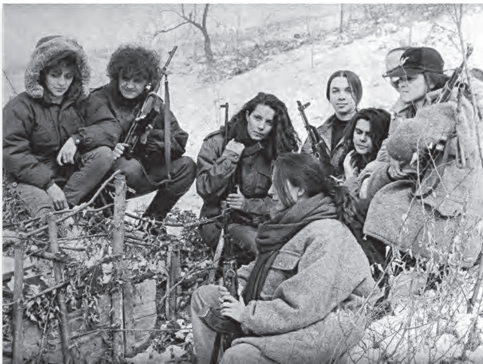
"Plave ptice" na Žuč