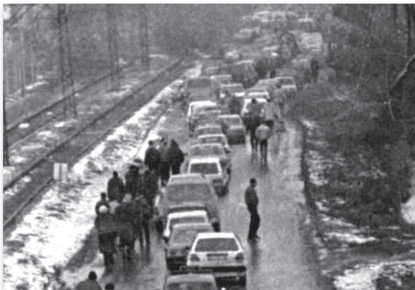
Reintegracija Sarajeva: Srbi napuštaju Grbavicu

Palama i okolnim naseljima, vidi se da je to stanovništvo dobrim dijelom pomjereno iz grada u te dijelove sarajevske okoline.