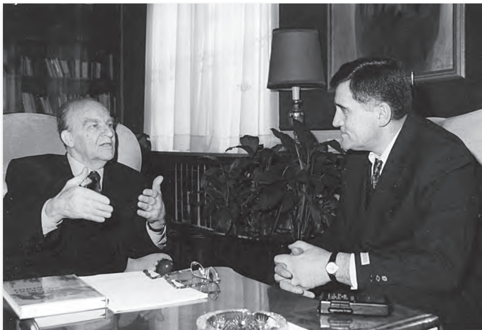
Sarajevo, 6. januara 2000. - Predsjednik Alija Izetbegović i autor za vrijeme završnog razgovora o Srebrenici u Predsjedništvu BiH

Ne mogu a da Vas ne zamolim za Vaše viđenje onih nekoliko čudnih rečenica koje je Karl Bilt napisao o padu Srebrenice u svojoj knjizi „Misija mir“. Parafrazirajući riječi tadašnjeg našeg ministra vanjskih poslova Muhameda Šaćirbegovića koji upravo u Strazburu saznaje za pad Srebrenice i opisujući njegovu reakciju, Bilt piše: „Njegova mirna reakcija i njegovo mirno rezonovanje spada u za mene još uvijek tajanstvene mozaičke kockice srebreničke drame. Srebrenica je za njih uvijek, rekao je, predstavljala veliki problem. Znali su da bi mirovni sporazum značio gubitak enklava. Na neki način bi ono što se desilo pojednostavilo stvari, rekao je otvoreno.“