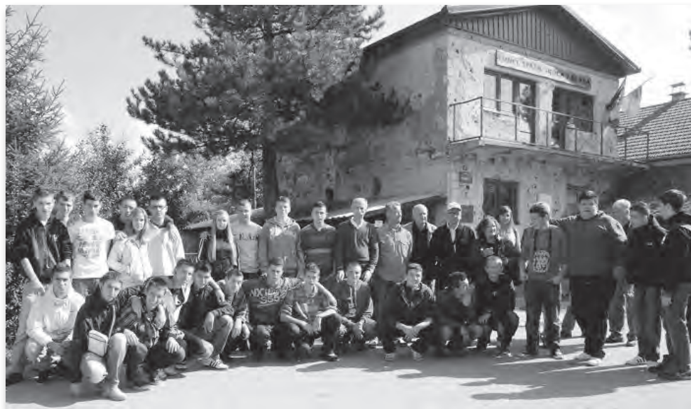
Pred sarajevskim „Tunelom spasa“

„Armija RBiH je bila uspješna ovdje od proljeća 1992. do ljeta 1993., kada je oslobodila Igman, Bjelašnicu, Trnovo, Rogoj, Golo brdo, Obeljak, Stupnik“, kazao je on i dodao: „Ljeto 1993. bilo je najteže za branioce Igmana i Bjelašnice, jer je srpski