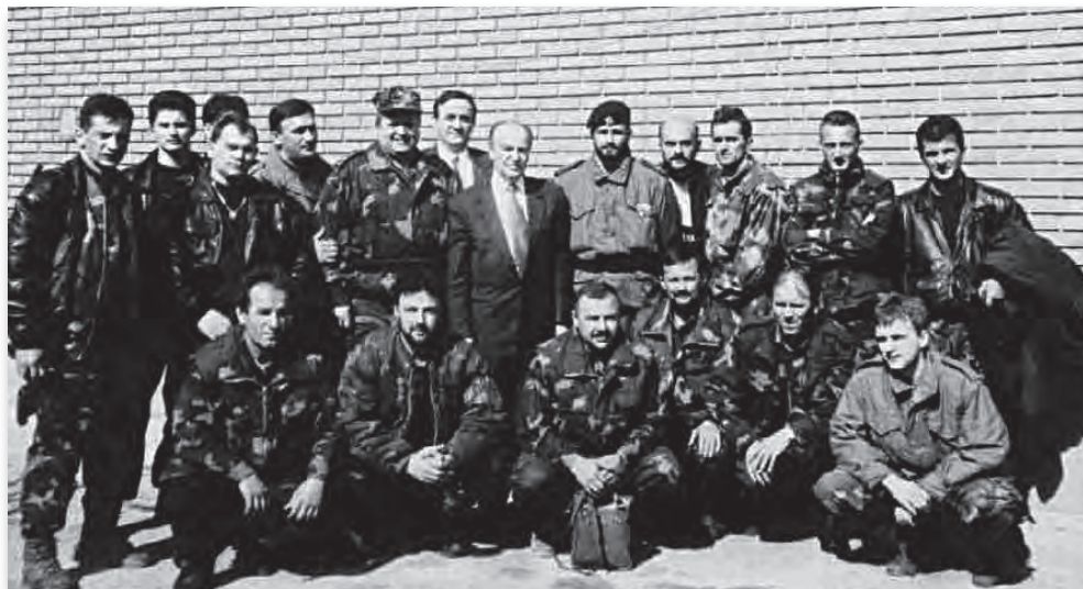
Kakanj, aprila 1995.: Predsjednik Alija Izetbegović i njegovi saradnici sa komandantima Žepe i Srebrenice. Ramiz Bećirović treći zdesna u prvom redu.

O svim problemima su upoznavani svi organi i Stranke na višem nivou, te Korpusa. Sve informacije su išle preko paketa koji je bio u Komandi, ali mi nismo dobijali povratne informacije i uputstvo o daljem radu.