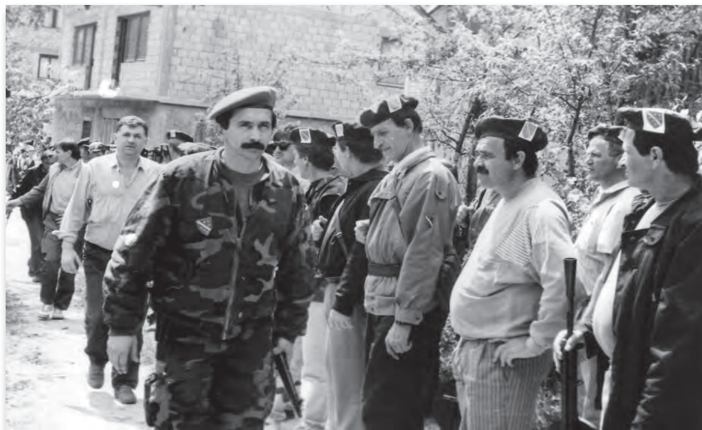
Prvi komandant Prvog korpusa Mustafa Hajrulahović Talijan vrši smotru jedinice na Šipu pred početak zakletve, avgust 1992.

strane JNA i njegovo oslobađanje u zamjenu za izlazak Komande 2. VO iz grada na prostor Lukavice, kao i Pofalička bitka, kojom je oslobođeno naselje Pofalići i spriječeno fizičko spajanje jakih snaga JNA u Kasarni Maršal Tito, sa srpskim snagama na Grbavici i Pofalićima, čime bi bilo izvršeno potpuno presjecanje grada. U ovom periodu izvršeno je preimenovanje 2. vojne oblasti JNA, pod čijom komandom su bili i svi naoružani sastavi SDS, u Vojsku Srpske Republike Bosne i Hercegovine.