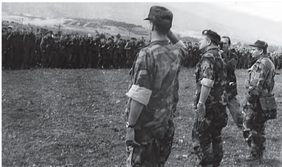
Bosanski Petrovac, 21. septembra 1995.: Komandant 5. korpusa Atif Dudaković pozdravlja borce 17. krajiške nakon njezinog dugog marša iz srednje Bosne u Krajinu. Desno od Dudakovića Fikret Čuskić, lijevo Sakib Forić

đer imali svoja čelna i začelna osiguranja koja su se sastojala od ojačanih vodova na čelu i začelju bataljona. 4