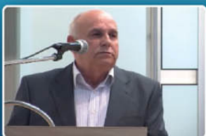
General Fikret Muslimović