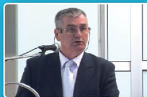
General Mustafa Polutak